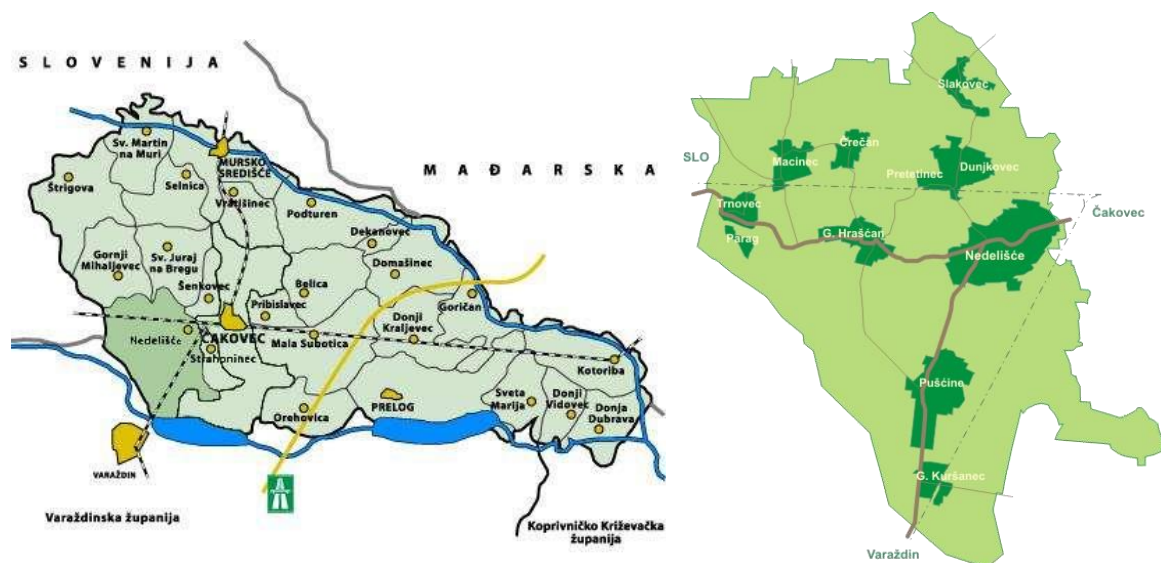
Slika 1: Položaj Općine Nedelišće u Međimurskoj županiji i položaj naselja unutar Općine

Načelnik Općine Nedelišće, kao izvršno tijelo, sukladno zakonskoj obavezi iz članka 173., stavka 3., Zakona o gospodarenju otpadom (NN 84/21) (u nastavku ZGO) izrađuje godišnje Izvešće o provedbi Plana gospodarenja otpadom Općine Nedelišće za 2022. godinu . Navedenom odredbom starijeg i novijeg Zakona propisano je da jedinica lokalne samouprave dostavlja godišnje izvješće o provedbi Plana gospodarenja otpadom jedinici područne (regionalne) samouprave do 31. ožujka tekuće godine za prethodnu kalendarsku godinu i objavljuje ga u svom službenom glasilu.